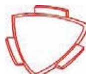
Ángulo interior vertical